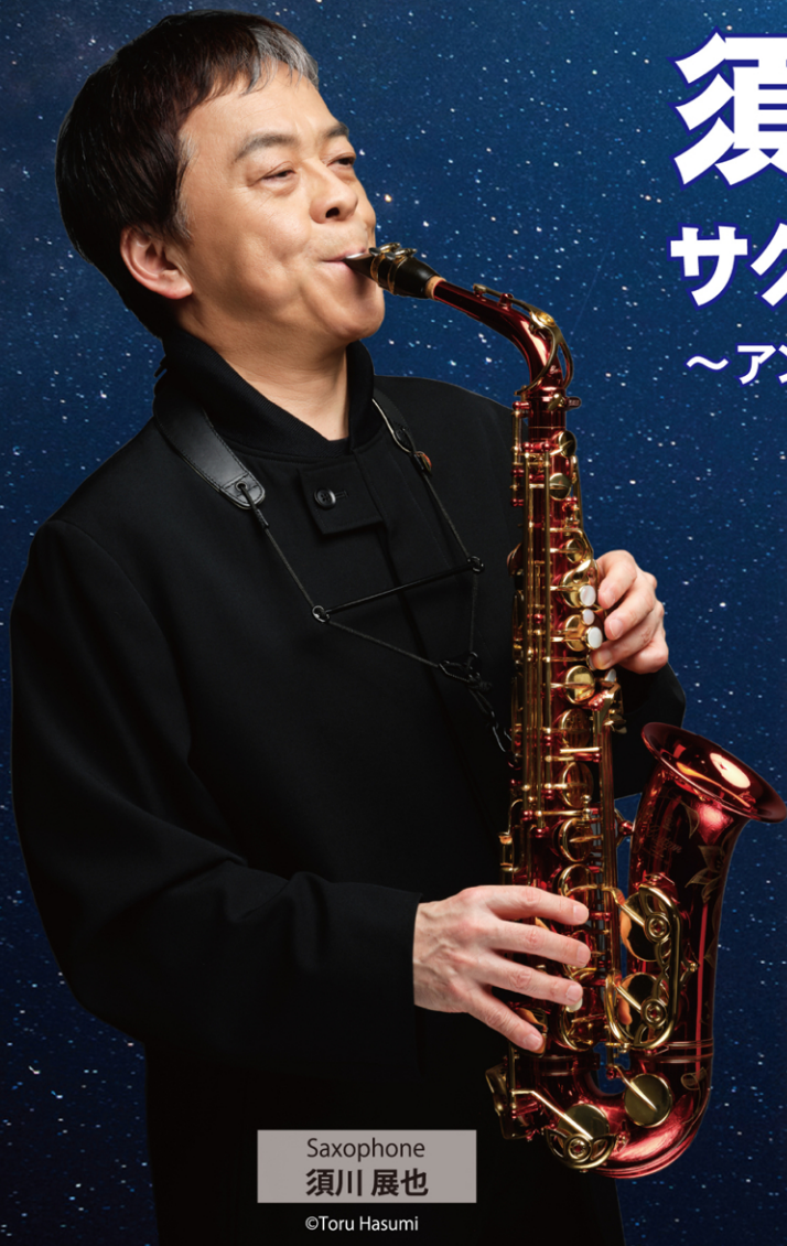
Saxophone 須川 展也