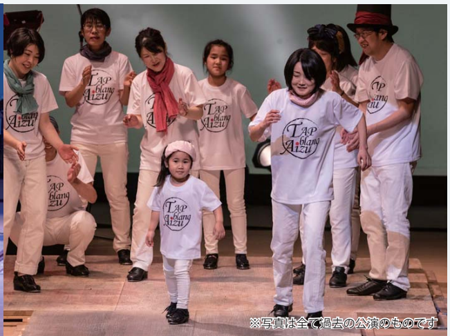
※写真は全て過去の公演のものです