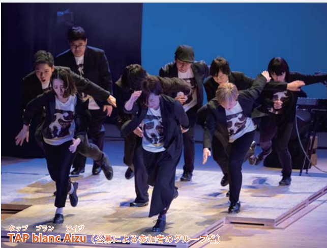
タップ ブラン アイブ TAP blanc Aizu (公演による参加者のグループ名)